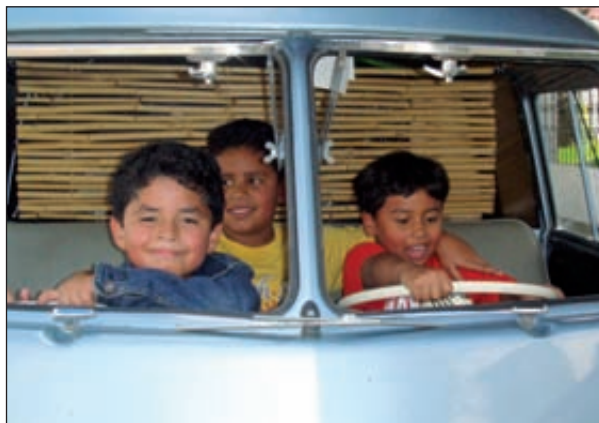
Les enfants de Gerson se prennent pour de grands aventuriers.