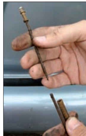
Le câble de compteur est cassé ! Mais à chaque solution son problème.