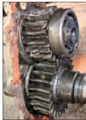
Pas de doute, les deux pignons réducteurs ont mangé chaud !