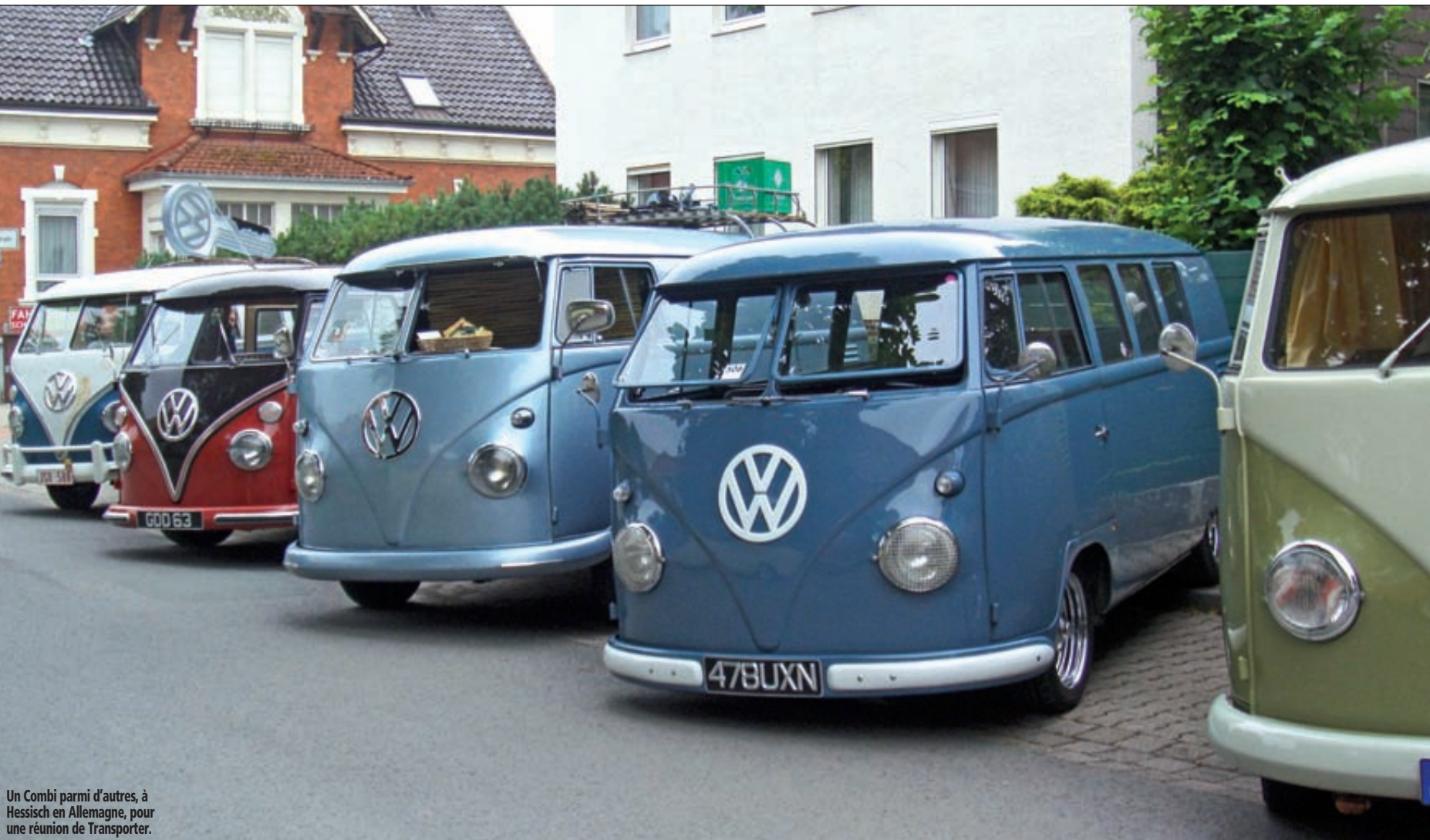
Un Combi parmi d'autres, à Hessisch en Allemagne, pour une réunion de Transporter.