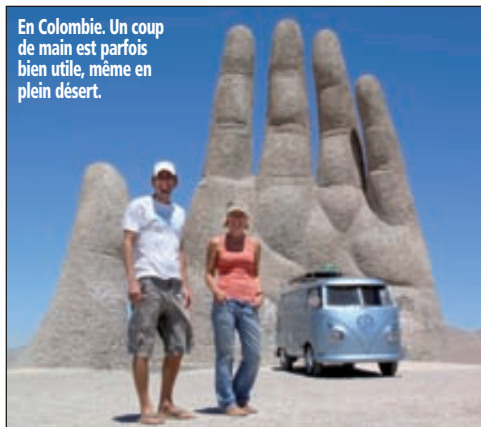
En Colombie. Un coup de main est parfois bien utile, même en plein désert.