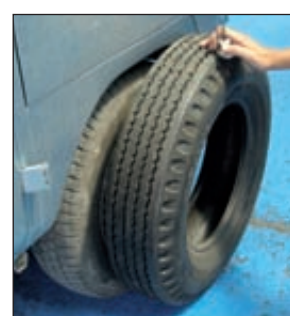
Raté ! La taille des pneumatiques pose un vrai problème. Trouver du quinze pouces en Colombie relève du miracle.