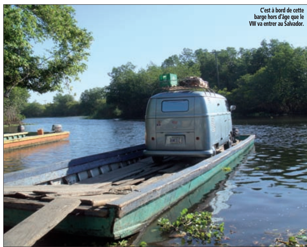
C'est à bord de cette barge hors d'âge que le VW va entrer au Salvador.