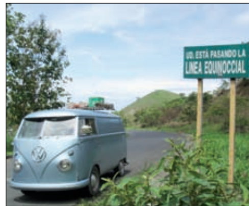
Le passage de l'équateur est signalé, même sur les plus petits chemins.