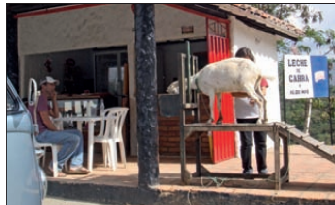
Pat est devenu accroc au lait de chèvre. Plus frais, tu meurs !