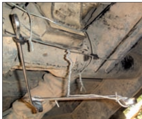
Le roulement intérieur de l'arbre primaire ne voulait pas venir tout seul. Il a fallu improviser un système d'extraction barbare, mais efficace.

MacGyver, le retour. Pour maintenir la transmission qui se faisait la belle, Pat a fait appel au système D : du fil de fer torsadé et quelques clés sacrifiées.