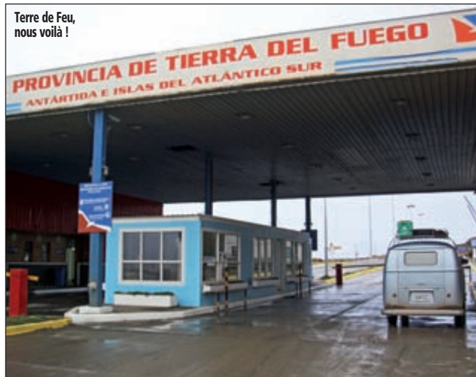
Terre de Feu, nous voilà !

Dans les Alpes autrichiennes. Paysages verdoyants. Ça change des déserts sud-américains.